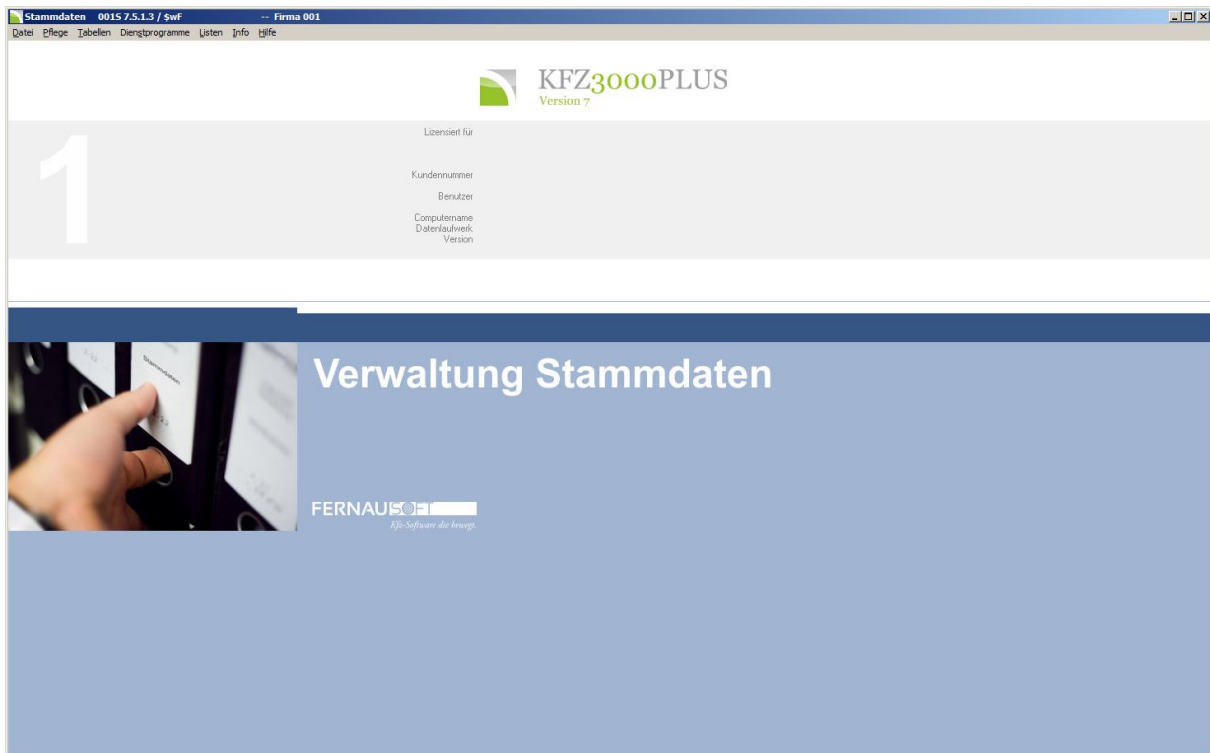
Abbildung 2: Verwaltung - Stammdaten