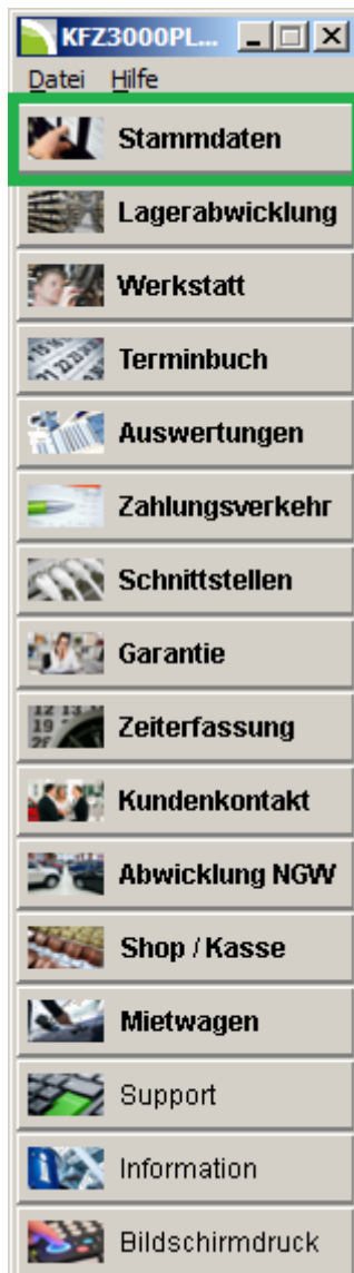
Abbildung 1: Hauptmenü

Zu den Herstellercodes gelangen Sie im KFZ3000PLUS Hauptmenü mit dem Button: Stammdaten :